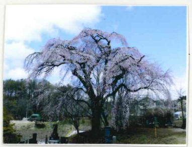
たかもりぼち 高森墓地しだれ桜