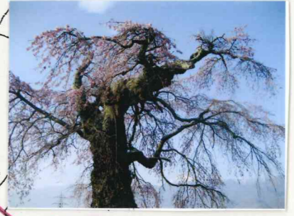
くすくぼ 葛窪しだれ桜