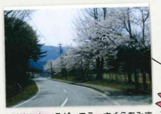
さかいしょうがっこう さくらなみき 境小学校桜並木

樹齢 250年 高森観音堂 お堂公開日 桜の開花時期 GW(5/1~5/5) 毎週土日(通年)