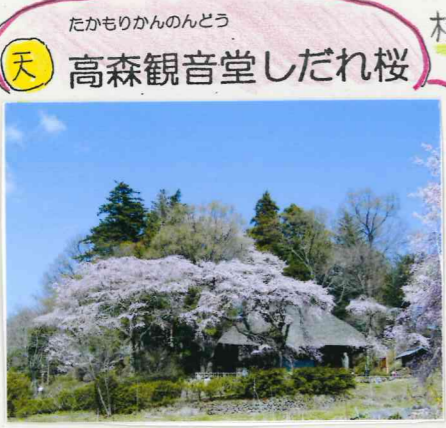
たかもりかんのんどう 天 高森観音堂しだれ桜

樹齢 250年 高森観音堂 お堂公開日 桜の開花時期 GW(5/1~5/5) 毎週土日(通年)