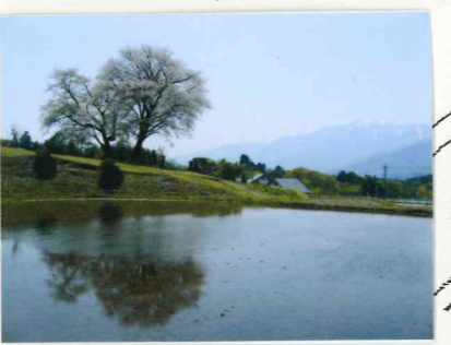
たばたもりしんでんざくら 田端森新田桜 ていだんざくら (鼎談桜)