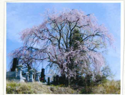
たばた 田端しだれ桜